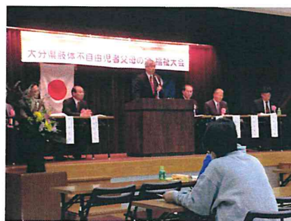
御来賓のあいさつ