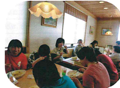
お楽しみの外食デー