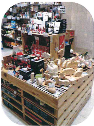
東京arobo広尾販売の様子です