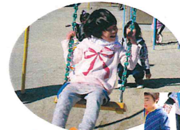
ブランコ だーいすき