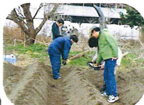
じゃがいもの植え付け