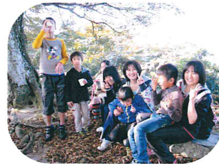
城山 頂上でひとやすみ