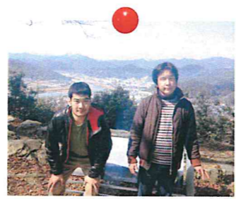
講演途中天気もよかったので城山に登りました。ごめんね!!