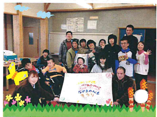
なかまネットのみなさま

平成26年2月21日(金) 午後1時から 夢ひこうせんにて きょうされんなかまネット (なかまの会)に3名の方が 参加しました。 たのしかったよ・・・ また行きたい・・・