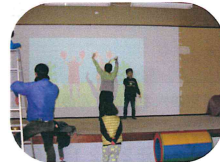
今流行ってます！エビカニビクス