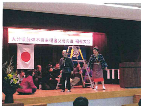
吉四六さんのてんのぼり