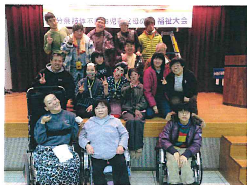
吉四六さん・おへまさんと記念撮影

平成26年2月21日(金) 午後1時から 夢ひこうせんにて きょうされんなかまネット (なかまの会)に3名の方が 参加しました。 たのしかったよ・・・ また行きたい・・・