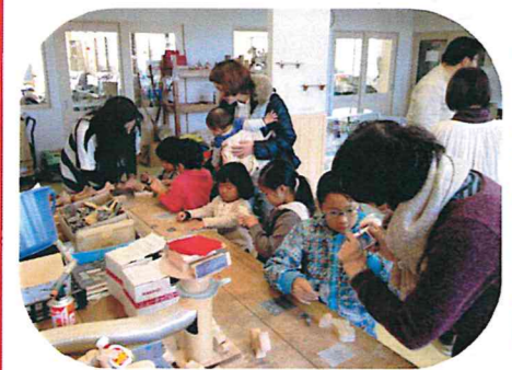
木工ワークショップ